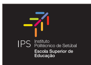
Logótipo a cores em fundo preto