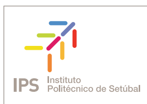
Versão Institucional | a cores

Está unicamente prevista uma utilização do logótipo na sua versão institucional completa. Simultaneamente será adoptado para os vários contextos e suportes, os respectivos materiais de expediente – reporta-se a documentos dirigidos simultaneamente ao público interno e externo ao IPS (ofícios, envelopes, recibos, facturas, etc..). Exemplos: