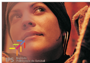
(i) uso de filtro de contraste para destacar o logo sobre a imagem