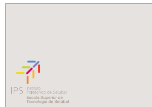
(ii) cor de fundo que não interfira com nenhuma das que compõem o logo