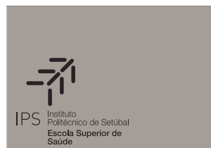
Logótipo a preto sobre fundo de cor

Apresenta-se na versão CMYK (para impressão offset /digital), RGB (para visualização em écran) e Pantone (para impressão offset em cor directa), as cores que compõem o isótipo IPS.