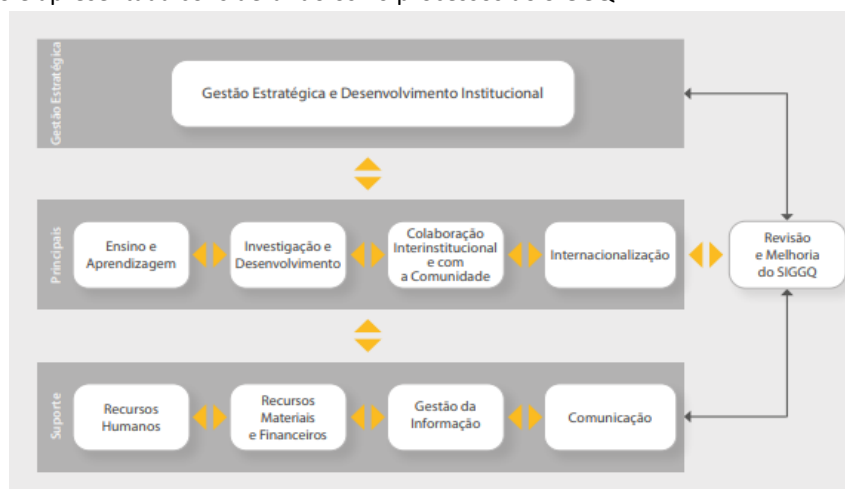
Figura 2. | SIGGQ | Mapa de Processos

A informação é apresentada considerando os 10 processos do SIGGQ: